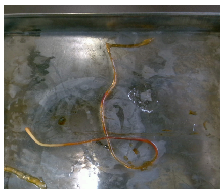
図5 塩化カルシウム水溶液