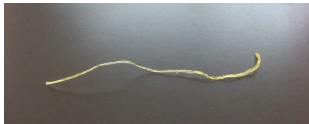
図6 水酸化ナトリウム水溶液