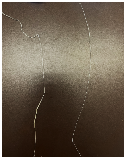
図7 ドデシル硫酸ナトリウム水溶液