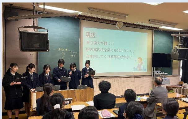
駅構内の案内をするロボットの提案