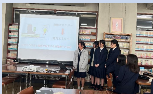
新しい発電方法の提案