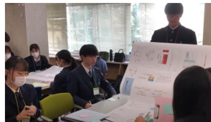
みんなで評価モデレーション

生徒の感想 ・他校の生徒と交流する事で、自分自身の考え方が大きく変化し、また違った考えを知ることができて非常に良かった。・思っていたよりカジュアルに楽しめたので良かったです。・生徒の企画は行動力が半端ないと思いました。・多くの力が身につくと分かり、成長したことが実感できました。探究は将来のためになると改めて思いました。