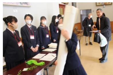
当日受付も生徒実行委員で