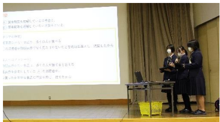
ステージ発表の様子