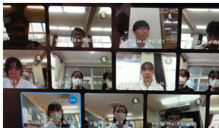
Google Meet での生徒実行委員会

令和5年12月27日(水)武生高校葵講堂や自習室を会場に、各校の課題研究の成果を持ち寄り、発表し合い、互いにフィードバックを行うことで、各校の課題研究の発展に寄与する「SDGs×Diversity！」～Respect the will of the individual～が行われました。4年目となる今年は規模を拡大し、県外からの参加も積極的に募りました。当日は県内外より8校、約100名の生徒・教員が参加しました。また、交流会全体の企画・運営を行う実行委員を校内・外から募り、外部のファシリテーションの専門家を招聘し、実践的な知識やスキルを学びました。教員を対象に、武生高校が日ごろから取り組んでいる「モデレーション」をテーマとした研修も行われました。県内大学・自治体から5名の講師に参加いただき、ご助言をいただきました。