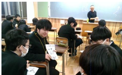
専門家によるファシリテーション講習